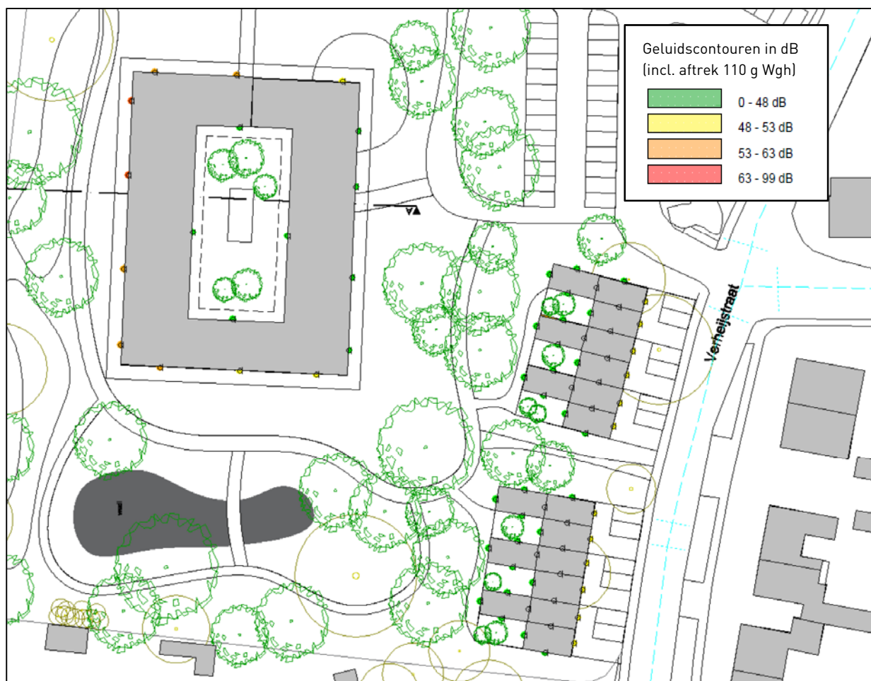
Figuur 3: Cumulatieve geluidsbelastingen ( L_{CUM,plus} )

In de onderstaande figuur zijn de cumulatieve geluidsbelastingen ( L_{CUM,plus} ), inclusief aftrek op grond van artikel 110g Wgh, in kleuren weergegeven: